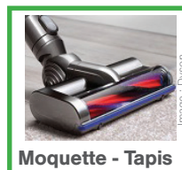
Moquette - Tapis