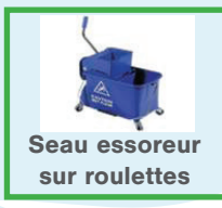
Seau essoreur sur roulettes